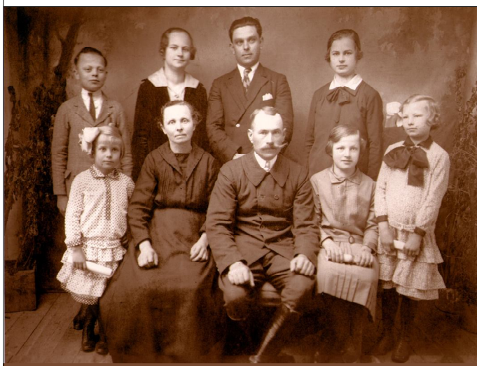
Egy magyar paraszt család ünneplőben a két világháború között

Alapítványunk segítő szolgálatában számtalan nehéz helyzetet találkoztam már. Fáj, ha tehetetlen vagyok, mert a problémák gyökere nem a pénztelenségben van. Az már általában következmény. Hová kell visszatérnie társadalmunknak, hogy magára találjon?