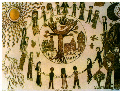
150 - Batta Eszter - Béke - Szülő

Köszönetet mondunk mindazoknak, akik adójuk 1%-át Alapítványunknak utalták. Annak minden forintját a kerületünkben élő rászorulóknak megsegítésére fordítjuk.